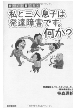
育つ力と育てる力 「私と三人息子は発達障害です。何か?」 廣済堂出版